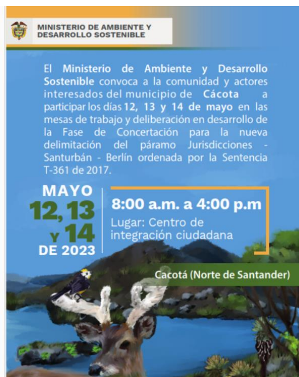
Imagen 3. Pieza de convocatoria a reunión de Concertación, Municipio de Cécota, 2023

En este sentido, una vez descritas todas las actividades realizadas en cuanto a la Convocatoria en cada una de las fases desarrolladas hasta el momento en el proceso de delimitación del Páramo Jurisdicciones-Santurbán-Berlín: Informativa, Consulta, Concertación, con énfasis en los municipios de Mutiscua y Cécota, se