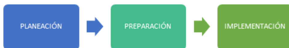
Ilustración 1 Plan de Trabajo para el desarrollo de las mesas de trabajo virtuales.