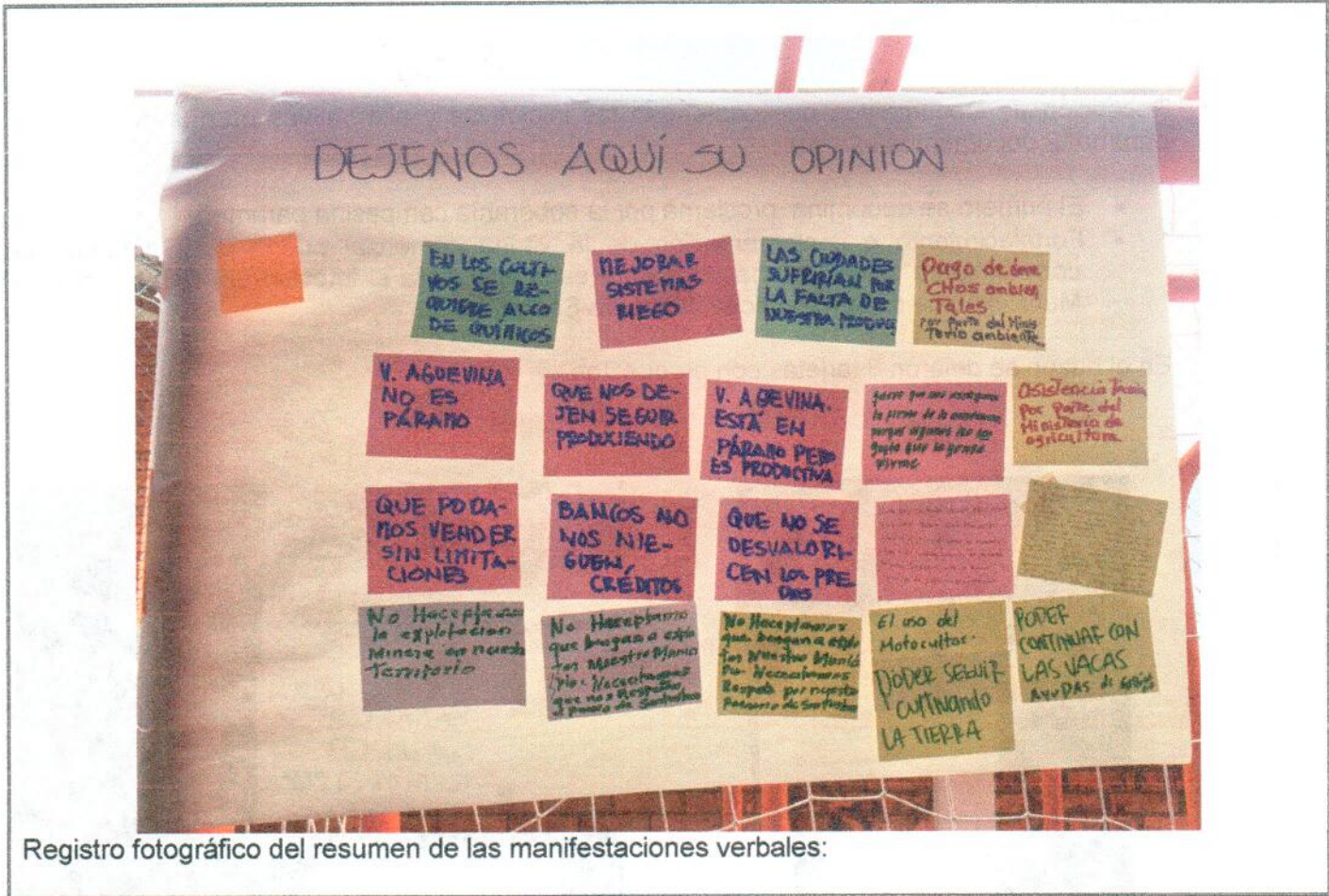
Registro fotográfico del resumen de las manifestaciones verbales: