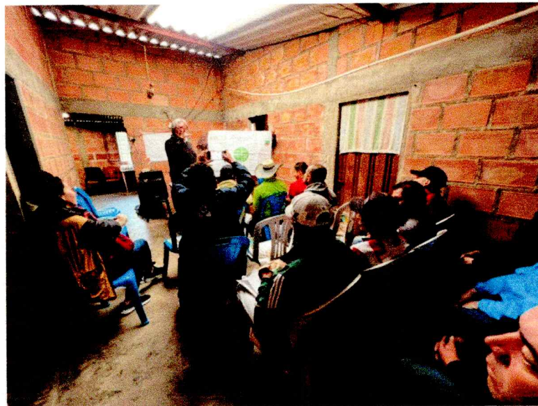
Fotografía del espacio de concertación

Listado de asistencia Registro fotográfico