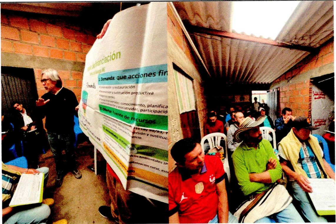
Nota: fotografía del espacio