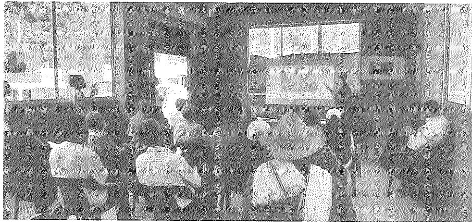
Fotos No. Reunión mesa de trabajo presencial - Municipio Santa Barbara

(Relacionar las evidencias tales como listas de asistencia, fotografías, videos, informes, entre otros)